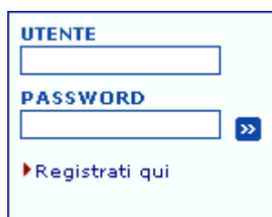
Immagine 7: accesso alla funzione di registrazione Smart Card

L'accesso alla funzione di registrazione si trova nella pagina principale del portale, nella sezione riservata all'autenticazione dell'utente ( Immagine 7 ).